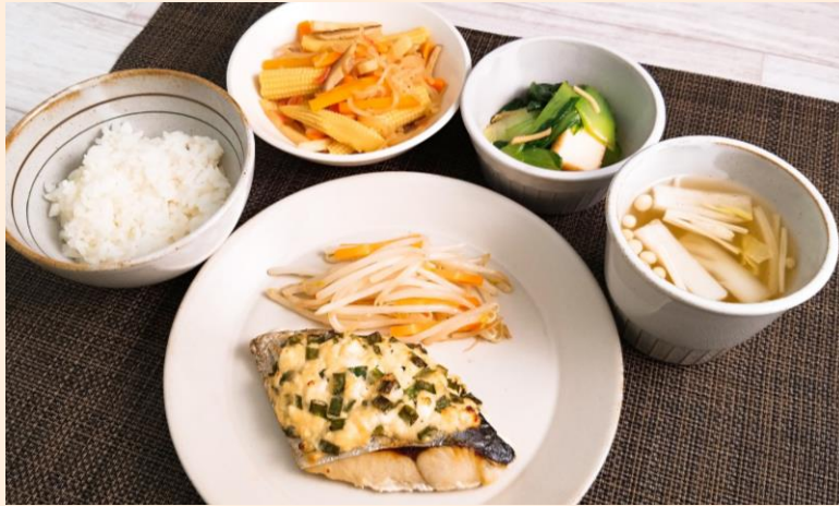
男性:栄養充足率(%表記)